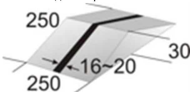
Горка для соревнования «Счетчик-траектория»